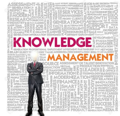
تدوین شده در واحد تضمین کیفیت